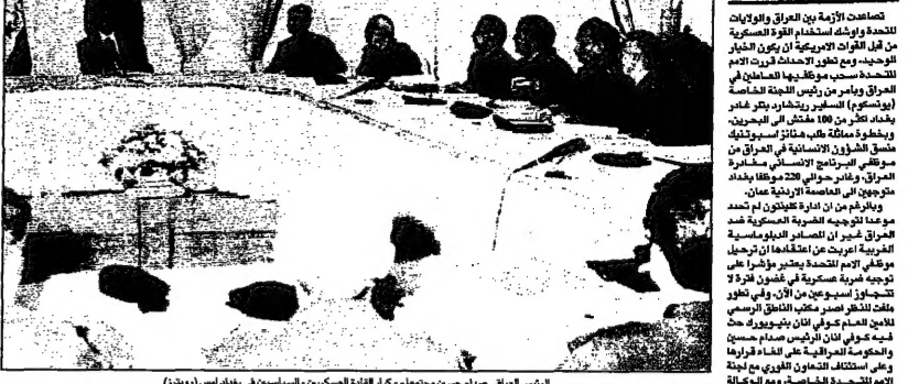
ثيودور القيس العربي - صلاح عودة

مصادر: الهجوم بعد اسبوعين ان تأخر عن السبت.. او بعد رمضان